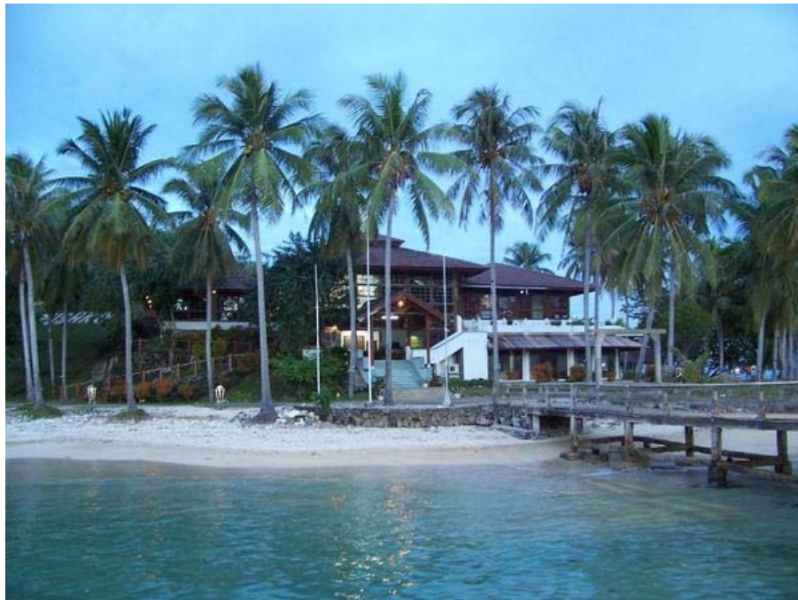
Figure 1 Moyo Island, Pulau Sumbawa

Pulau Sumbawa merupakan sebuah pulau di Provinsi Nusa Tenggara Timur, Indonesia. Luas wilayahnya 10.710 km 2 , dan titik tertingginya adalah Gunung Wanggameti (1.225 m). Sumba berbatasan dengan Sumbawa di sebelah barat laut, Flores di timur laut, Timor di timur, dan Australia di selatan dan tenggara. Selat Sumba terletak di utara pulau ini. Di bagian timur terletak Laut Sawu serta Samudera Hindia terletak di sebelah selatan dan barat.